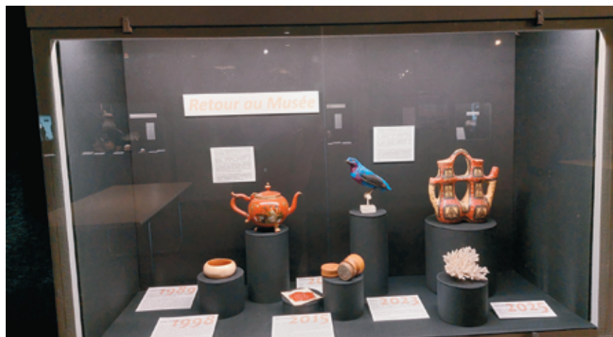
«Retour au musée» (thème de la vitrine).