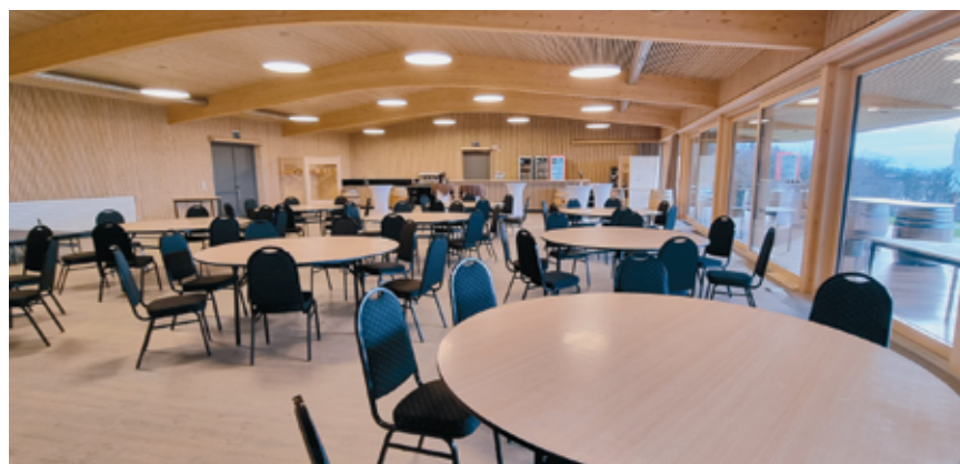
Vue de l'intérieur de la halle.