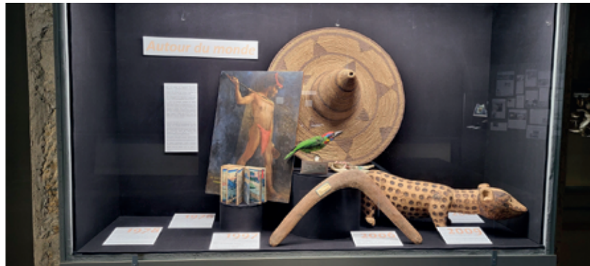
«Autour du monde». (thème de la vitrine).