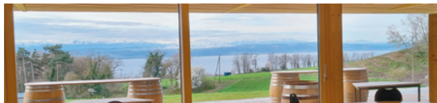
Vue sur le lac et les Alpes depuis l'intérieur de la halle.