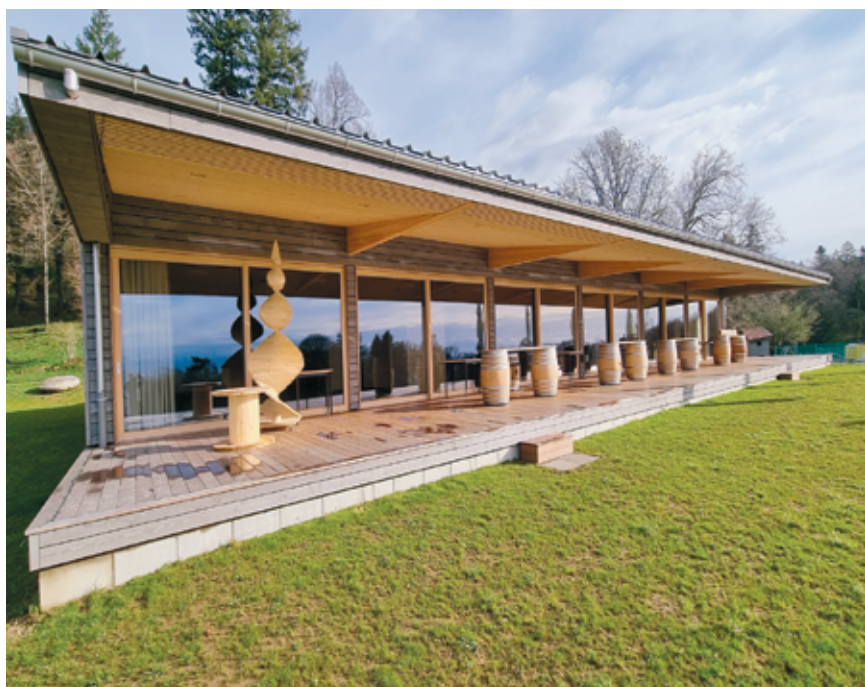
La halle vue du sud.