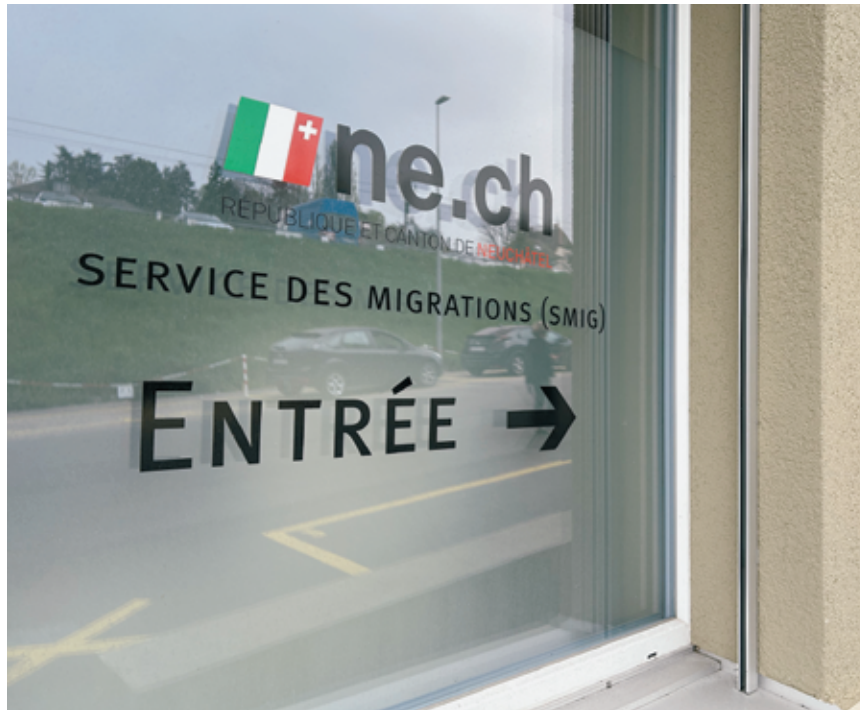
L'affaire est allée jusqu'au Tribunal fédéral, tous les recours ont échoué.

Pour le garçon, la situation est terrible. «Je termine l'école secondaire et je voudrais trouver une place d'apprentissage dans l'immobilier ou la comptabilité, mais personne ne peut m'engager. Je me suis inscrit à l'École de commerce, en attendant...». Son jeune frère, 14 ans, et sa petite sœur de 8 ans, née à Neuchâtel, souffrent du stress. «C'est très difficile de travailler à l'école quand on a peur tout le temps.» Les enfants connaissent peu l'albanais, pas du tout le Kosovo. Ils ne se confient pas à leurs amis, ils ont peur. «Toute notre vie est ici.»